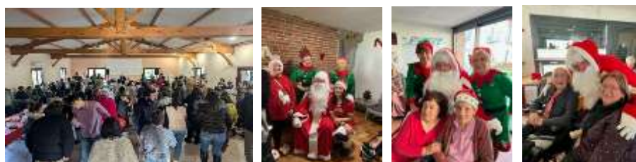
FAM, MAS, Foyer de Vie, EHPAD

Quoi de plus naturel certes mais oh combien fort en émotion de voir personnes accompagnées, professionnels et familles partager ces moments festifs.