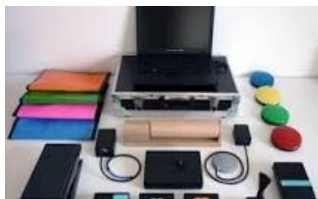
Rosalie 6 places

Le fonds de dotation de l'AJH participe en 2023 au financement de 2 projets importants : un orgue sensoriel et une Rosalie électrique qui nécessitent des financements complémentaires.